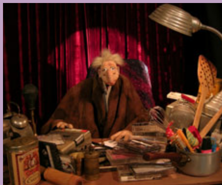
El circ que fa meravelles

La princesa Amira d'Aràbia decideix fugir per evitar que el seu pare, el rei Mustafà, la casi amb un sultà que ella no coneix. El mateix li passa al príncep Arnau, quan sa mare l'obliga a enamorar-se de l'al·lota que és capaç de notar un pèsol davall set matalassos. Què passaria si es coneguessin?