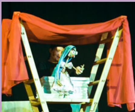
Titelles i música en directe