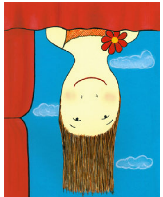
L'obra que es convertirà en l'11è cartell.

Ara només fa falta que els dissenyadors facin la seva feina i que els cartells amb l'obra de Sitges comencin a penjar-se devers el proper mes d'octubre per acabar de confirmar que la XI Fira de Teatre infantil i juvenil de les Illes Balears és a punt de començar.